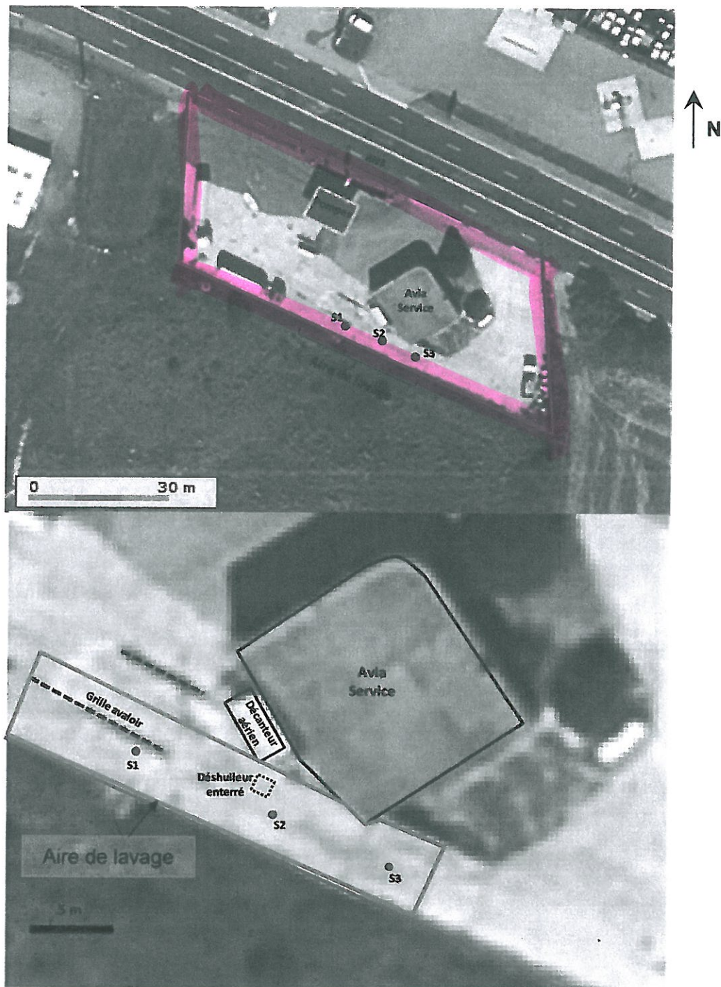
Figure 2 : Localisation des sondages sur photos aériennes